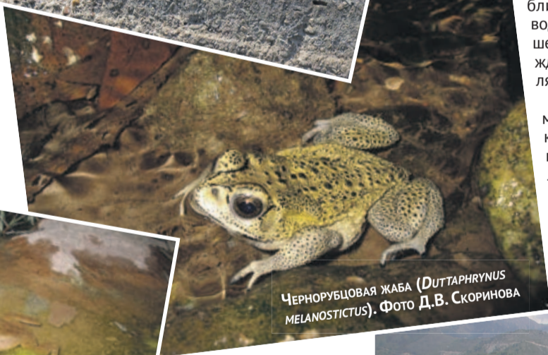
ЧЕРНОРУБЦОВАЯ ЖАБА ( DUTTAPHRYNUS MELANOSTICTUS ).