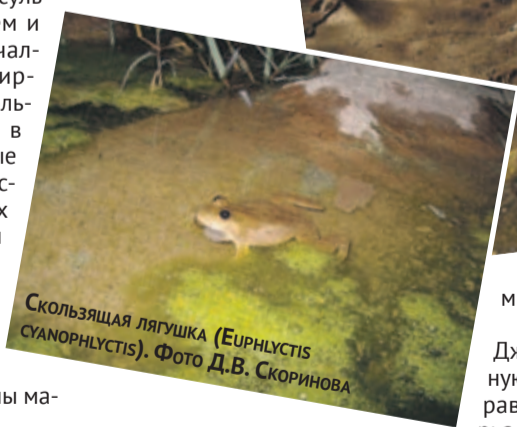
Скользкая лягушка ( EUPHYLCTIS CYANOPHYLCTIS ).