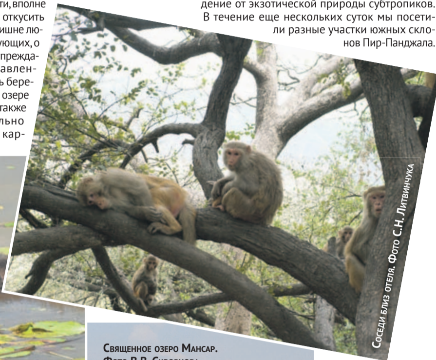
СОСЕДИ БЛИЗ ОТЕЛЯ.