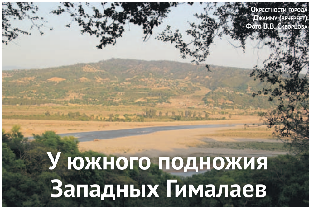
ОКРЕСТНОСТИ ГОРОДА ДЖАММУ (ВЕЧЕРЕТ).