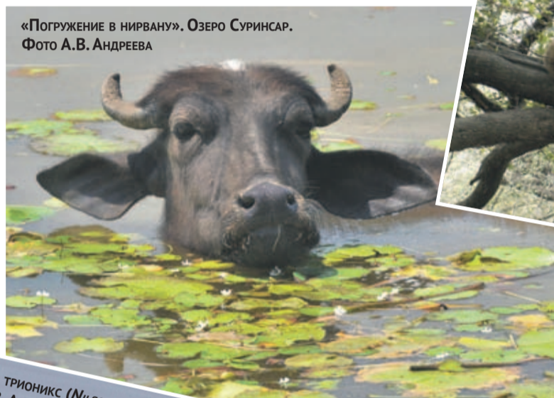
«ПОГРУЖЕНИЕ В НИРВАНУ». Озеро Суринсар.

Штат разделен на три больших части (региона), которые сильно различаются во многих отношениях, включая природу, этнический и религиозный состав населения, языки и даже кухню. Это преимущественно индуистский Джамму, мусульманский Кашмир и буддийский Ладак. Официальным центром штата является город Джамму (ударение на у), расположенный на юго-западе и называемый также зимней столицей, так как в жаркое время администрация штата перемещается в летнюю столицу город Шринáгар (Srinagar), лежащий за хребтом Пир-Панджал в более про-