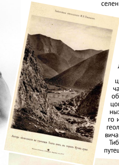
Вид на Тибетское нагорье с перевала к югу от озера Даши-куль (Певцов, 1895)

(Улан-Батор) и Улясутай в июне вернулся в Россию (село Кош-Агач).