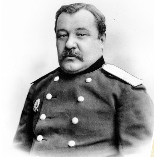
Портрет М.В. Певцова (1895)

ский язык, начал осваивать арабский, а затем географию и историю Китая. В 1875-м был переведен в Омск. Первоначально Певцов преподавал географию в военной гимназии и написал учебник по физической географии (1881).