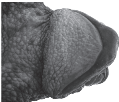
Рис. 4. Серая жаба с кривой верхней челюстью

«Калужские засеки» данная аномалия отмечалась только в одном – широколиственном – лесу.