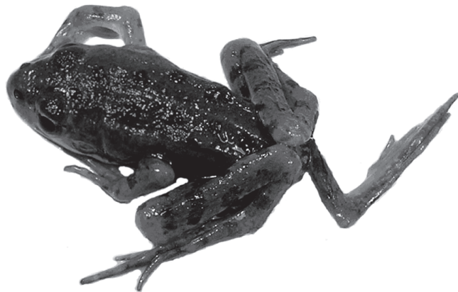
Рис. 1. Сеголеток озерной лягушки с полимелией

Полимелия ( Polymelia ) отмечена в августе 2008 г. в Калуге, микрорайон Турынинские Дворики, в пруду у сеголетки озерной лягушки – Pelophylax ridibundus (Pallas, 1771). Выражена развитием дополнительной задней ноги (рис.1). По Волжскому бассейну известны единичные находки [Файзулин, 2011; Замалетдинов, 2003; Borkin, Pikulik, 1986].