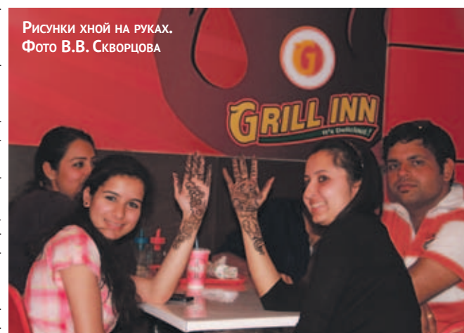
Рисунки хной на руках.

ТрВ-Наука — информационный партнер СПбГУ по Гималайскому проекту