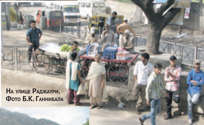
На улице Раджаури.