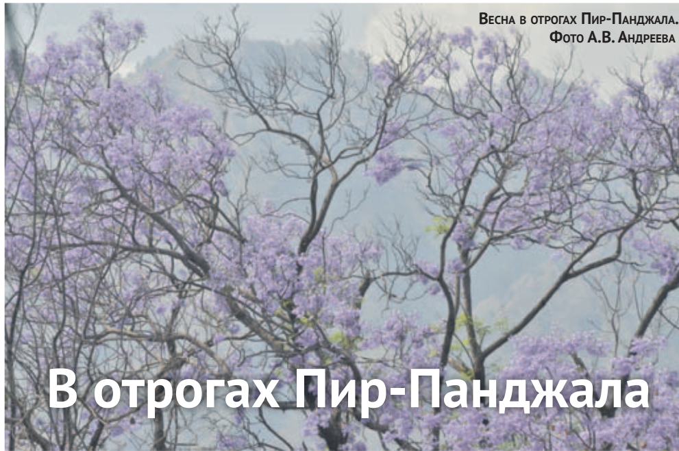
Весна в отрогах Пир-Панджала.