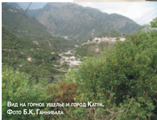
Вид на горное ущелье и город Катра.

Солнце садилось, и мы решили спуститься к широкой галечниковой пойме реки, чтобы поискать там животных. Нам любезно указали тропинку, по которой в обоих направлениях сновали жители. Выйдя к реке, мы слегка опешили. Среди камней около «ванн» с