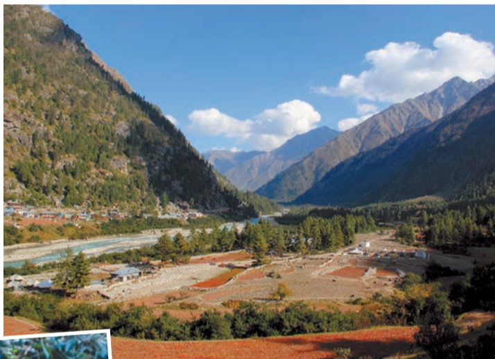
Долина Баспа близ деревни Ракчам. 2 октября 2011 года.

Местные жители, киннорцы, носят характерные шапочки с зеленым кантом и говорят на своем диалекте киннорского языка ( читкули ). Хотя большинство из них индуисты, они не пренебрегают и буддийскими богами, и храмы этих двух конфессий могут мирно находиться рядом друг с другом, как мы это видели в деревне Читкул. В ней пока еще сохранилась местная архитектура, лишённая пышности и кича и