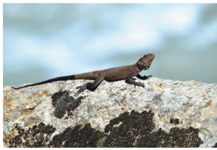
Горная агама. Сатледж — Баспа. 1 октября 2011 года.

1 октября, выехав из сказочного Сарахана (см. [2]) вверх по Сатледжу, в середине дня мы оказались у небольшой горной гидроэлектростанции (1547 м), строительство которой было закончено в 2009 году. Ее дамба заодно служила удобным мостом через бурные воды. Недалеко на левом берегу впадал довольно крупный приток. Это было устье реки Баспа. Поджидая, пока подъедет минивэн с остальными участниками экспедиции, мы принялись безуспешно ловить юрких горных агам — ящериц длиной около 25–30 см (с хвостом), близкие родственники которых обитают на Памире, Тянь-Шане и в других горных системах Средней Азии.