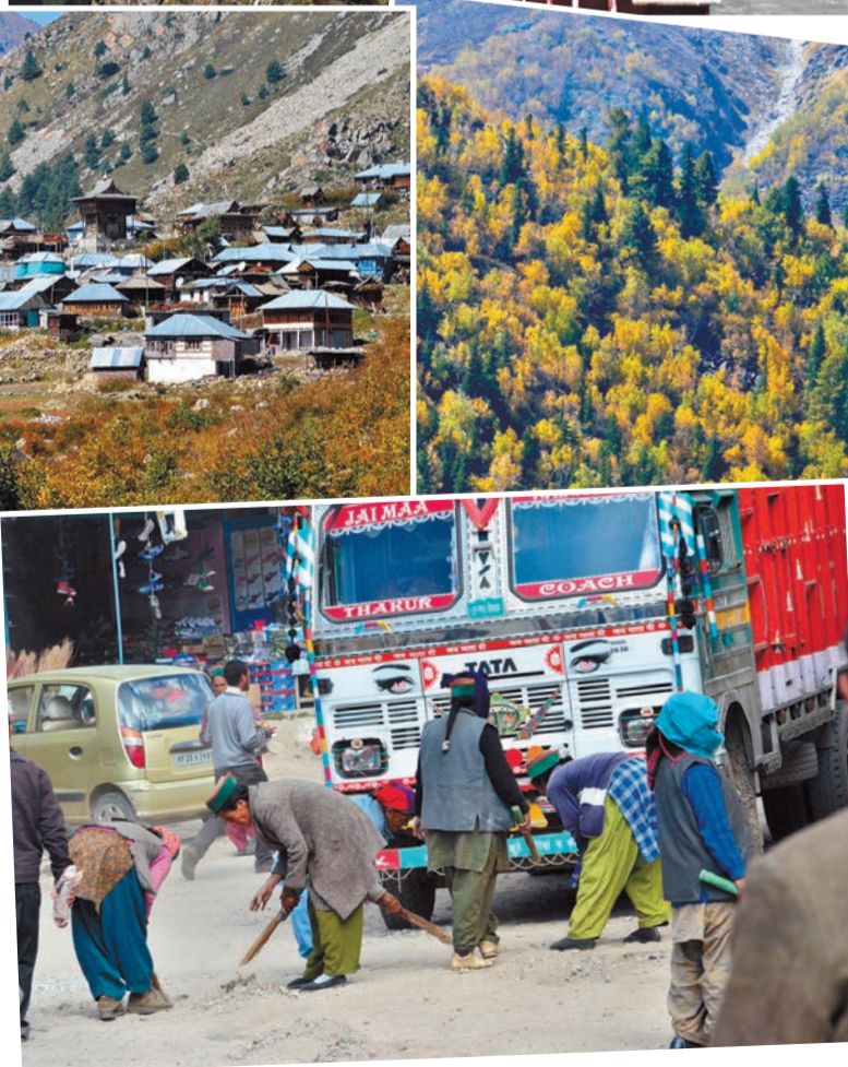
Сангла. Уборка улицы. 1 октября 2011 года.

На одном опасном повороте, где часто происходят аварии, поселился добрый садху. Водители обязательно останавливались возле его незамысловатой будки, чтобы воздать должное одинокому отшельнику. Тот протягивал блюдо со сладостями, угощая каждого, и, благославляя, ставил красную тилку (или тилаку, пята из порошка с растительной смесью, иногда с глиной и т.д.) на лоб чуть выше перенос-