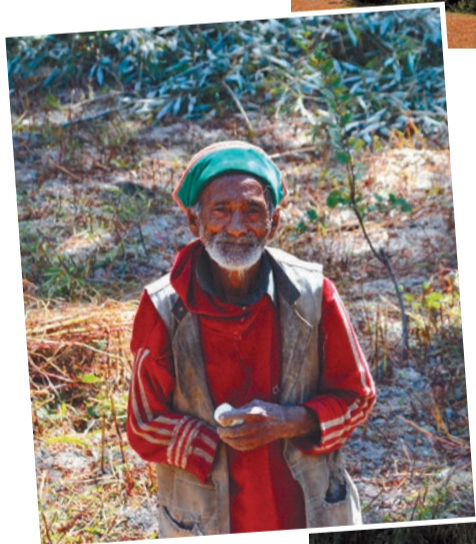
Житель Ракчама. 2 октября 2011 года.

Однако красота долины обманчива, и жизнь здесь не проста. В январе 2011 года около сотни индийских туристов чуть не погибли, занесенные снегом, а в сентябре 2010-го около Читкула прошли мощные оползни, вызванные сильными дождями. Тем не менее два приятных дня, проведенных в гостеприимном Ракчаме и долине Баспа в целом, сейчас вспоминаются как необычный сон.