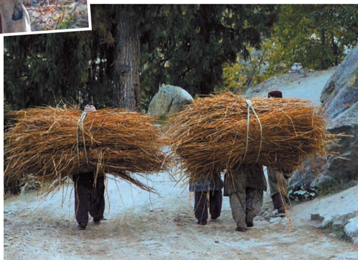
Заготовка хвороста. Ракчам. 2 октября 2011 года.

Отсюда Баспа собирает свою кристальную воду, которая после слияния многочисленных холодных ручейков бурлящим потоком несется вниз, достигая Сатледжа и в конечном итоге Инда. Местные ледники питают также истоки другой знаменитой реки, которой поклоняются в Индии, — священной Ганге (в Индии она женского рода). В 1962 году территория в районе Ракчама и Читкула на высотах между 3200 и 5486 м площадью в 32 км 2 была объявлена заповедником. Здесь обитают снежный леопард, гималайский и бурый