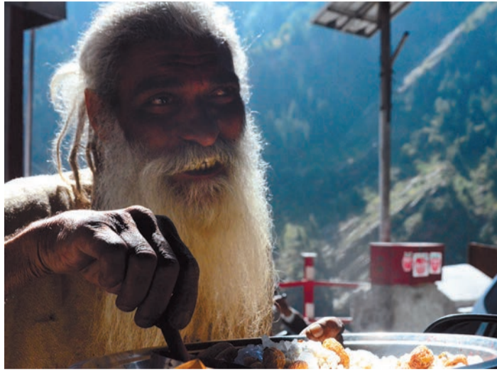
Добрый садху угощает. 2 октября 2011 года.

► нам, что их род происходит от самого бога Шивы. От предложенных ему алкогольных напитков Раджеш отказался, пояснив, что не хочет, чтобы в него вселилась ярость.