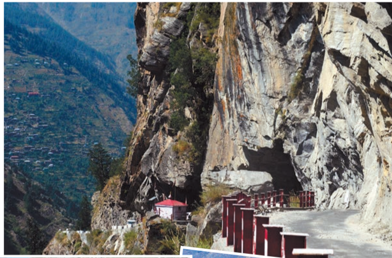
Опасный поворот (красная крыша — будка садху). Баспа. 2 октября 2011 года.

Проехав несколько деревушек, представлявших собой дома и хижины разного качества, разбросанные по относительно пологим склонам ущелья, иногда почти до гребня горного хребта (по-видимому, кто-то очень любит свежий воздух или предпочитает одиночество), мы попали в поселок Сангла (Sangla, 2665 м). Это — фактически главное поселение на