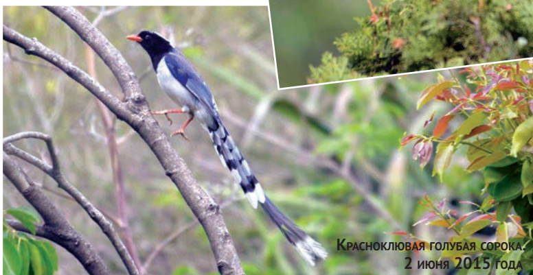
Красноклювая голубая сорока. 2 июня 2015 года

Дорога в эту удивительную местность лежит вне обычных туристических маршрутов, и нашим водителям приходилось довольно часто уточнять наш путь. Первая ночевка запланирована в маленьком селении Арки (Arki), найти которое оказалось делом непростым. Извилистая трасса шла сквозь живописные сосновые леса ( Pinus roxburghii ), пересекая горы на высотах 1200–1400 м. Нашему взору открывался вид на