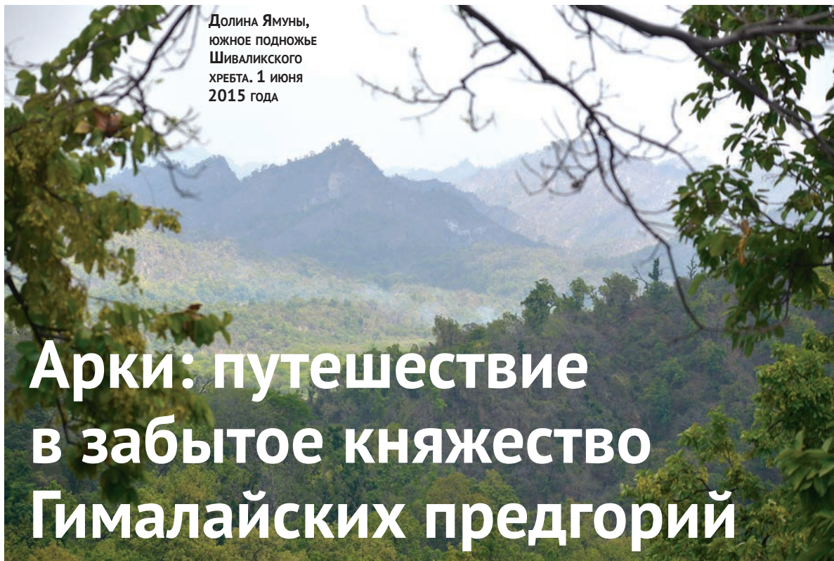
Долина Ямуны, южное подножье Шиваликского хребта. 1 июня 2015 года

Сразу за границами парка начинается территория штата Химачал-Прадеш. Вскоре мы сделали остановку на берегу небольшого притока Ямуны, в русле которого спасались от жары стада буйволов, а на берегу расположилась группа кочевни-