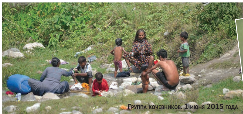
Группа кочевников. 1 июня 2015 года

ков. Под раскаленными камнями в пойме реки зоологам удалось найти крохотных жабыт и лягушат.