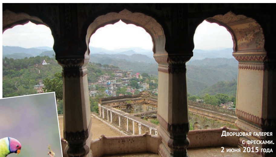
Дворцовая галерея с фресками. 2 июня 2015 года