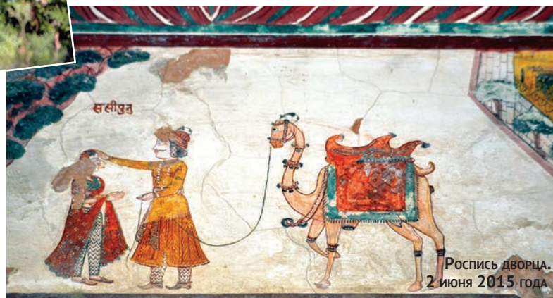
Роспись дворца. 2 июня 2015 года

Поразила неожиданная эклектичность сюжетов. Сцены индийского эпоса («Махабхарата») перемежаются видами европейских ▶