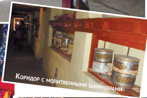
КОРИДОР С МОЛИТВЕННЫМИ ЦИЛИНДРАМИ