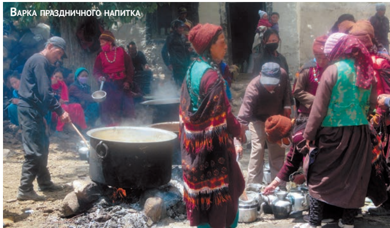
ВАРКА ПРАЗДНИЧНОГО НАПИТКА

да, закрыл глаза и стал медитировать. Мы предположили, что он из Японии, но один из молодых занскарцев сказал нам, что это — святой из Тибета. Местные женщины и мужчины, подходя к нему, прикладывались к руке.