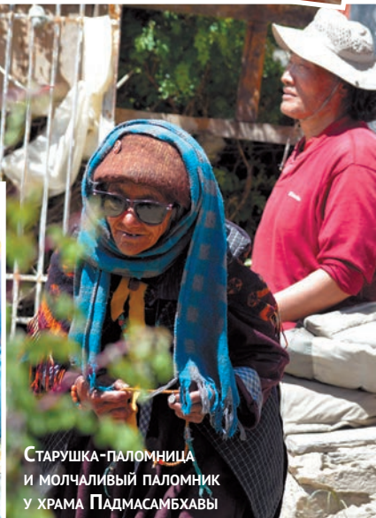
СТАРУШКА-ПАЛОМНИЦА И МОЛЧАЛИВЫЙ ПАЛОМНИК У ХРАМА ПАДМАСАМБХАВЫ