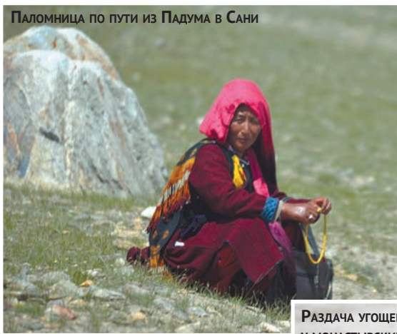
Паломница по пути из Падума в Сани

там монастыря, расположенного на удаленной от реки окраине деревни на подгорной равнине. В путеводителях [3] отмечают три особенности этого монастыря. Во-первых, он расположен в долине, а не в горах или на вершине холма. Действительно, известны лишь еще две старинные гомпы, построенные на припойменных террасах рек. Это — Алчи на реке Инд (Ладак) и Табо в долине Спити (Хима-