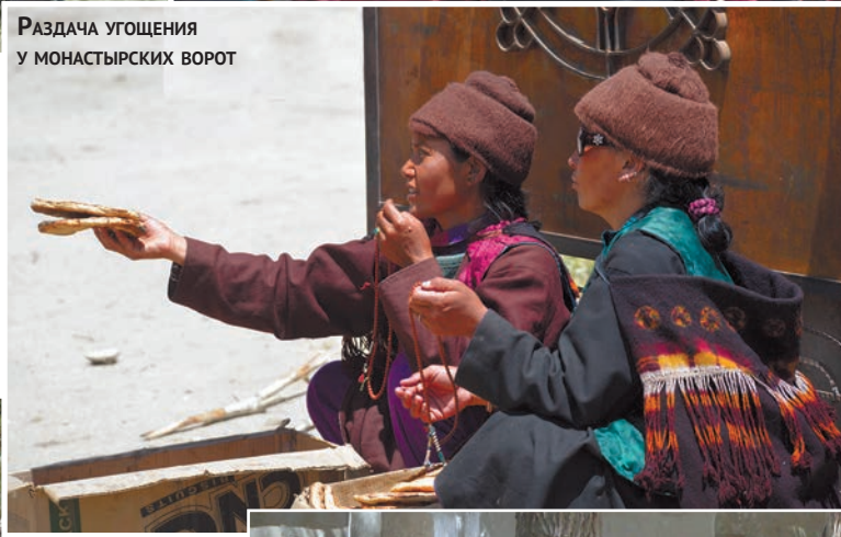
Раздача угощения у монастырских ворот

ных разездов на один день в Падуме пришлось нанять шофера, который оказался неплохим парнем. Он сообщил нам, что в Сани проходит праздник, укрепив наше намерение попасть в этот старинный монастырь.