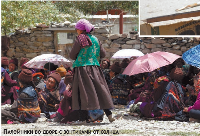
Паломники во дворе с зонтиками от солнца

Ехать было недалеко. Деревня Сани расположена всего в 6 км вверх по правому берегу реки Дода (Stod River) от Падума. Здесь в сво-