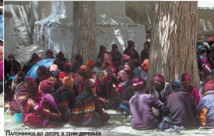
Паломники во дворе в тени деревьев

го приветствия Джулэй! один из нас получил пресную лепешку, другой — пакет с яблочным соком, а кому-то дали банан. Угощение получал каж-