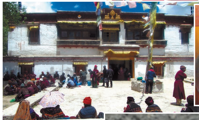
ГЛАВНОЕ ЗДАНИЕ МОНАСТЫРЯ

Сани II веком н.э. Между нею и монастырской стеной расположена небольшая «часовня» (Garnhat Lhakhang), где якобы пять лет жил Падмасамбхава. Вход в нее, завешенный белыми и желтыми хадэками (ритуальные шарфы из шелка или другой материи), был закрыт. Путеводители утверждают, что внутри имеется статуя этого великого гуру и других божеств, а на стенах — старинные фрески.