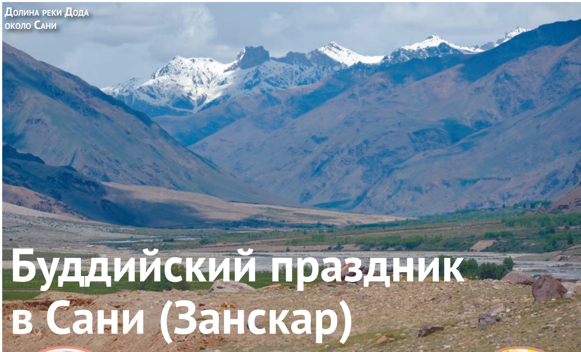
Долина реки Дода около Сани

Совсем рано, уже в 4 часа, в Падуме стало шумновато: из громкоговорителей с минаретов разносились речитативы муллы, потом слышался лай собак и бодрящая музыка. К 7 часам всё стихло, но бродить по окрестностям Падума не хотелось. Еще предыдущим