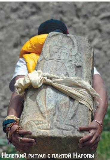
НЕЛЕГКИЙ РИТУАЛ С ПЛИТОЙ НАРОПЫ

Среди паломников наше внимание привлек немолодой грузный лама, явно не местный. На наши приветствия он лишь молча улыбался и, подойдя к «часовне», уселся на ступеньки у во-