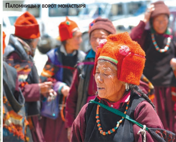
Паломницы у ворот монастыря