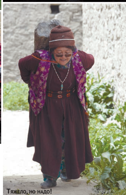
ТЯЖЕЛО, НО НАДО!

одна сотня гостей, главным образом женщин. Солнце палило нещадно. У входа в храм опять раздавали угощения. Нам перепало жареное в масле тесто, которое по вкусу напоминало «хворост». Динамик вещал молитвенный речитатив ламы. На этот раз нас пустили внутрь главного здания.