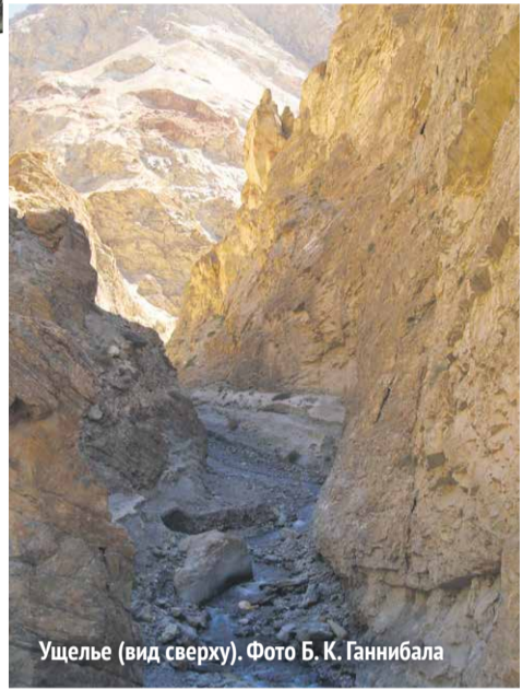
Ущелье (вид сверху).

Возле селения Чилинг (Chiling, Chilling) дорога сузилась. Здесь на выходе боковой долины расположен относительно крупный оазис. Дальше наш путь пролегал сквозь