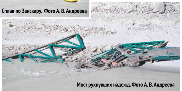
Мост рухнувших надежд.

переводиться как Медная долина (Zan-skar). Однако второй слог допускает и другие трактовки: Zangs-dkar ( белая медь ), Zangs-mkhar ( медный дворец ) или Zangs-skar ( медная звезда ). Встречается также перевод «дворец еды» (Zan-mkhar), что отра-