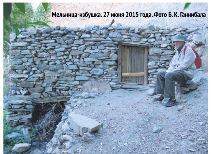
Мельница-избушка. 27 июня 2015 года.