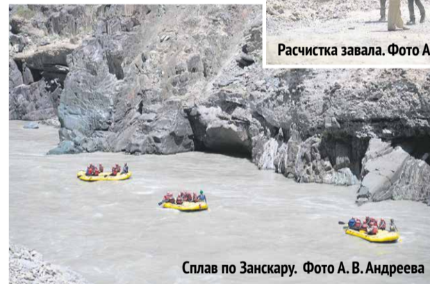
Сплав по Занскару.

Перед нами открывался притягательный вид. Река ленивым широким извивом уходила в манящую даль,