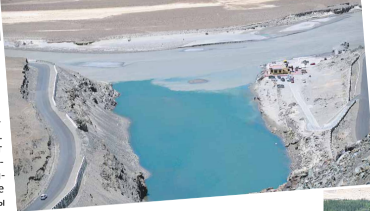
Голубой Инд со станцией для сплава и сероватый Занскар. 27 июня 2015 года.

Существуют три толкования названия. Согласно наиболее популярной версии, оно связано с залежами меди (по-тибетски зангс ) и буквально может