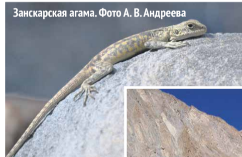
Занскарская агама.

Участок у Инда ныне благоустроен. На трассе установлены рифмованные добродушные пожелания водителям. В месте слияния с Занскарком выстроена станция сплавного туризма (рафтинга) с рестораном. Отсюда километров на 20–25 вверх по Занскарку заводят сплавщиков вместе с большими надувными лодками (рафтами). Сплавные маршруты, ставшие популярным времяпрепровождением у туристов в Гималаях, заканчиваются именно на этой станции близ Ниму.