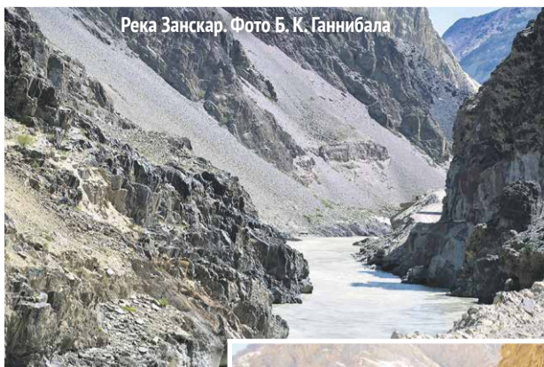
Река Занскар.

грозот от работы по расчистке трассы, за бульдозерами большая заводь и съезд к реке. Куски скал, свалившиеся со склонов гор и застрявшие посреди бурлящего потока. Пришлось подождать, пока дорогу не освободят от огромных валунов.