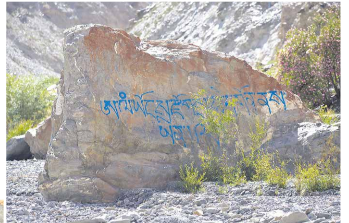
Тибетские надписи.

Возвращаясь к машине, натолкнулись около горной стены на две небольшие низкие избушки, сложенные из камней. Людей не было. Осторожно заглянули в одну из них. Это была мельница с горизонтальными колесами. От водопада к ней и далее был проложен желоб с бегущей водой. Рядом разбит маленький садик с худенькими стволиками ив. В скалах, освещенных по вершинам косыми лучами солнца, летала сорока.