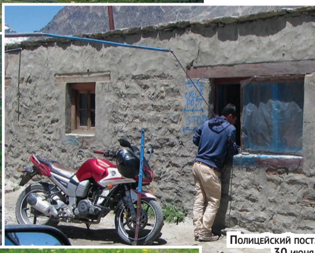
Полицейский пост, 30 июня