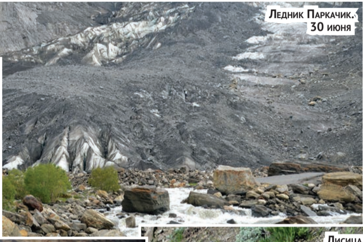
Ледник Паркачик. 30 июня