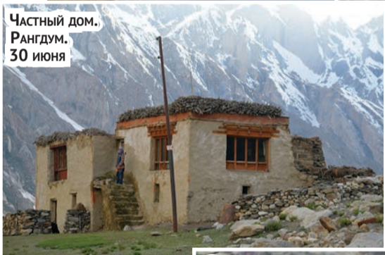
Частный дом. Рангдум. 30 июня