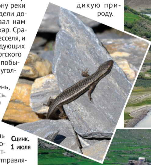
Сцинк, 1 июля