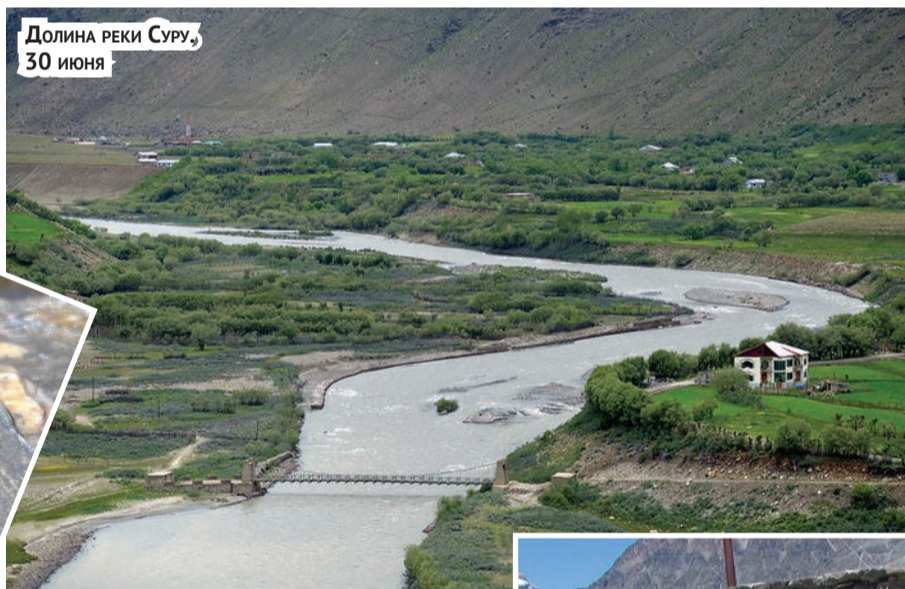
Долина реки Суру, 30 июня

За постом асфальт, и так весьма плохой, закончился совершенно. Дорога, перейдя на правый берег Суру, стала пыльной и отвратитель-