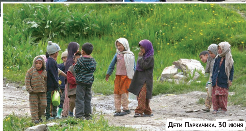
Дети Паркачика, 30 июня

Долина Суру (Suru Valley) обитаема с незапамятных времен. Ее население имеет дардское (индо-европейское) и тибетское (монголоидное) происхождение. В настоящее время здесь проживает около 25 тысяч человек. Район мусульманский; прежнее буддийское население было обращено в ислам в середине XVI века. Ныне в каждом селении начиная с деревни Минджи (Minji, 2804 м), первой после Каргила, на приметном месте построена