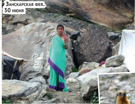
Занскарская фея. 30 июня