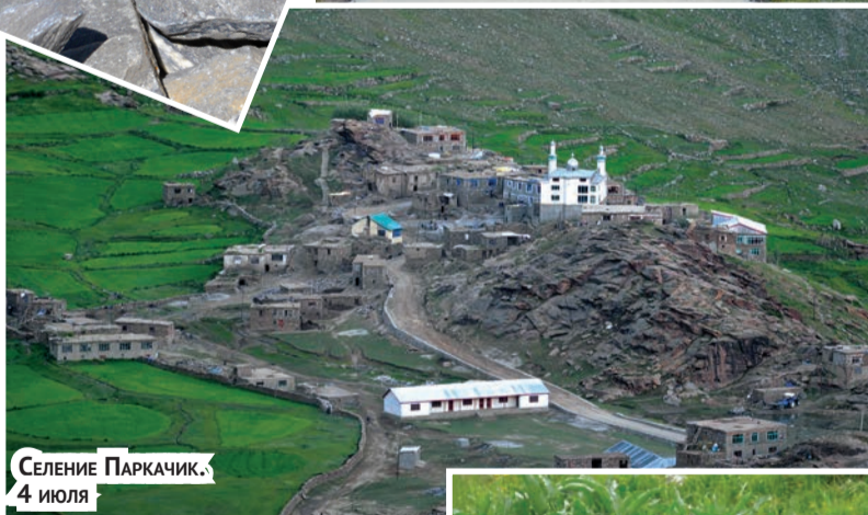
Селение Паркачик, 4 июля