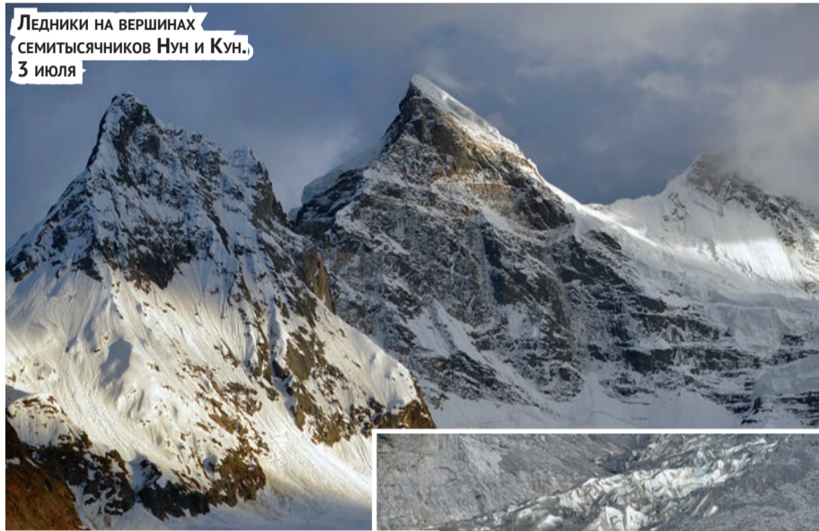
Ледники на вершинах семитысячников Нун и Кун. 3 июля