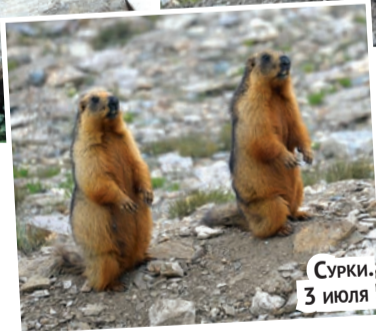
Сурки. 3 июля