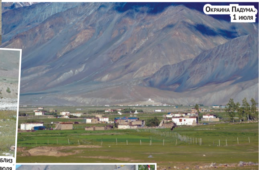
ОКРАИНА ПАДУМА, 1 ИЮЛЯ

важнейший транзитный пункт на трассе между Каргилом и Падумом. Из нашего гестхауса открывалась красивая перспектива на широкую альпийскую равнину, обрамленную величественными горными хребтами со снежными вершинами. На этом просторе река Суру распадалась на несколько рукавов. Сразу за селом в нее справа из ущелья вливался приток (Kanji La Tokro), по которому пешеходная тропа на север может вести через высокий перевал (Kanji La,