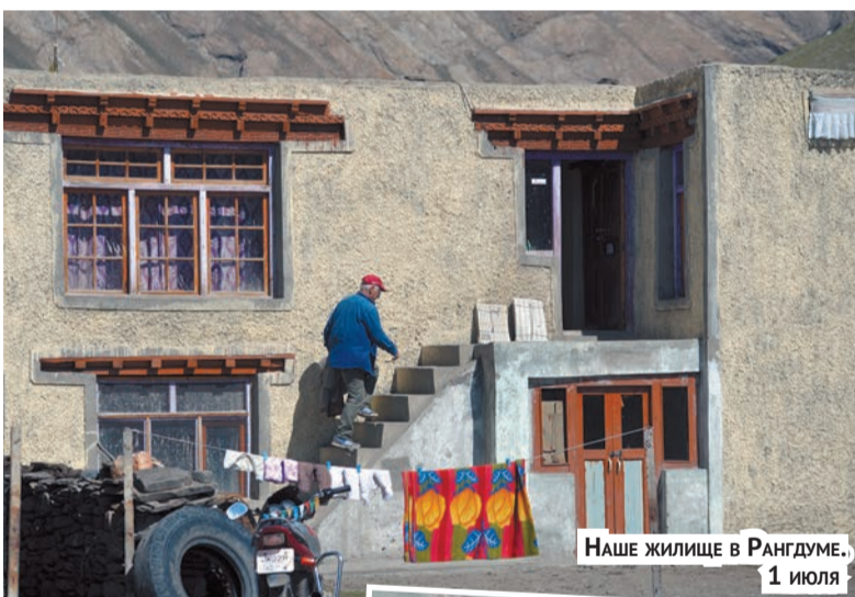
НАШЕ ЖИЛИЩЕ В РАНГДУМЕ, 1 ИЮЛЯ

В долине Доды было заметно теплее и суше, чем в долине Суру. В первой – меньше зелени, преобладали