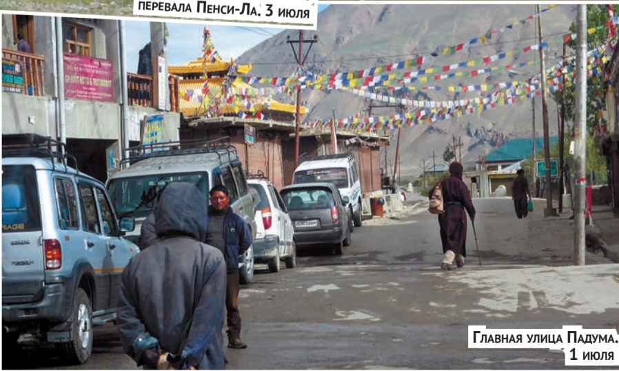
ГЛАВНАЯ УЛИЦА ПАДУМА, 1 ИЮЛЯ

Далее начиналась необитаемая зона верховьев реки Суру. Этот район своими тучными альпийскими пастбищами издревле привлекал кочевников племени бакарвал (Bakarwals), которые ежегодно пригоняют сюда на летний выпас стада овец и коз, пере-