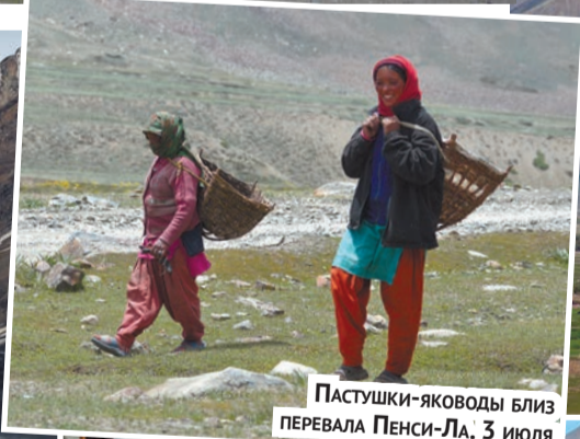
ПАСТУШКИ-ЯКОВОДЫ БЛИЗ ПЕРЕВАЛА ПЕНСИ-ЛА, 3 ИЮЛЯ