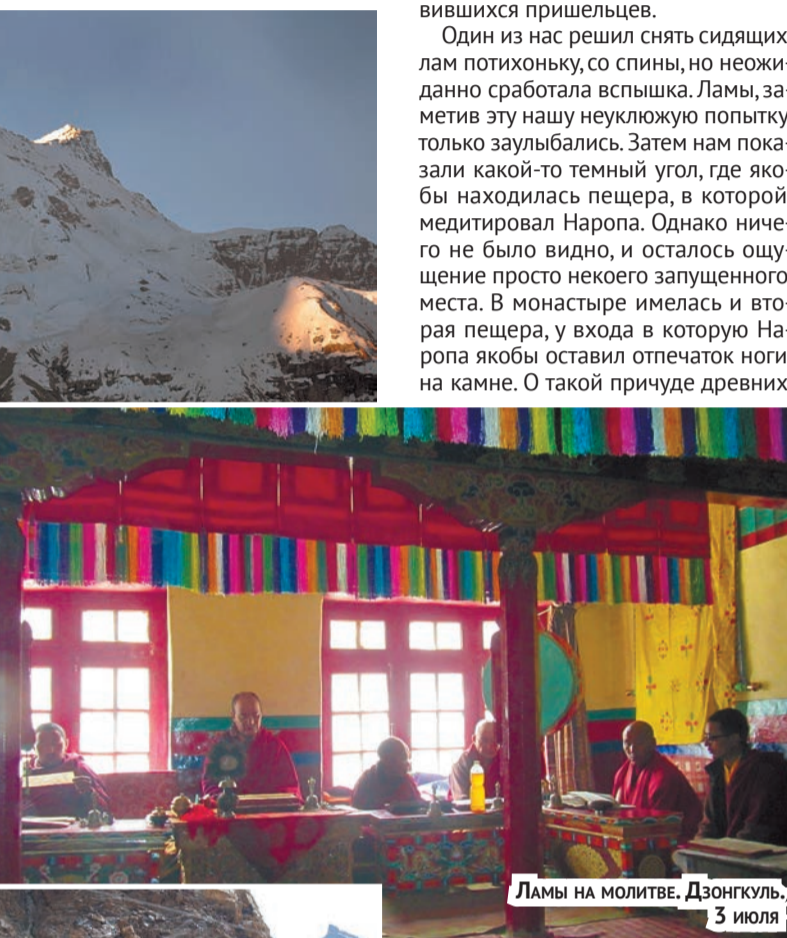
ЛАМЫ НА МОЛИТВЕ. ДЗОНГУЛЬ, 3 июля

Монастырь Дзонгкуль — пещерного типа, т.е. пристроен к скальной стенке с двумя пещерами. С его по-