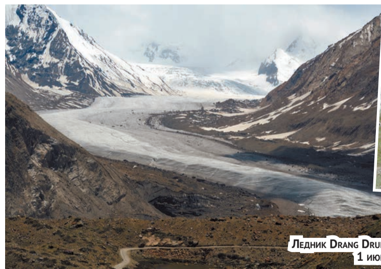
ЛЕДНИК DRANG DRUNG, 1 ИЮНЯ