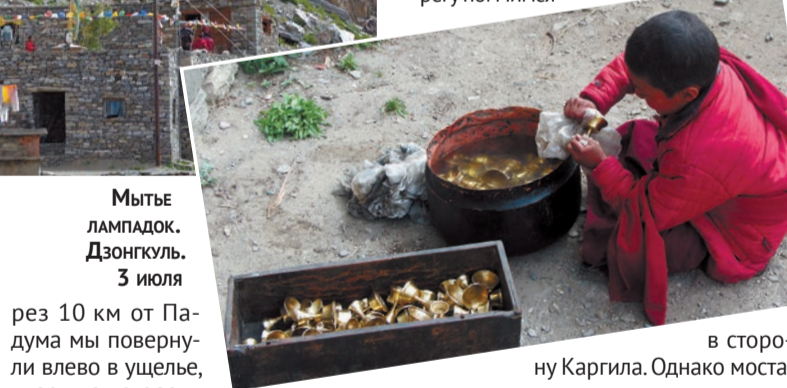
МЫТЬЕ ЛАМПАДОК. ДЗОНГУЛЬ, 3 июля

Планировалось, что, покинув монастырь и спустившись к реке, мы через мост, указанный на карте, пересечем Доду и по правому берегу помчимся