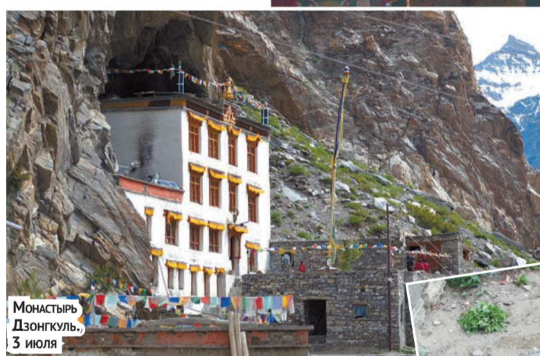
МОНАСТЫРЬ ДЗОНГУЛЬ, 3 июля

При входе в семейный гестхаус надо снимать обувь. Наши две комнаты с туалетом и душем в каждой располагались на втором этаже обособленно от основной части дома, где проживали члены семьи. По дому ходят босиком; комнаты, кровати и наволочки не по-индийски