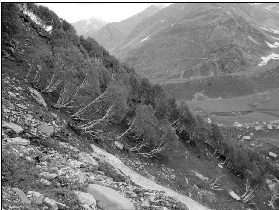
Ил. 5. Долина реки Чандры у перевала Ротанг Берёзовые рощи на склоне северной экспозиции. 15 июня 2015 года

На спуске с перевала, однако, становится тихо и безлюдно. При движении по долине реки к столице Лахула городу Кейлонгу (Keylong) ландшафты приобретают более привлекательный вид. Картины Н. К. Рериха 1931–1945 годов, посвящённые Лахулу, очень правильно передают особенности долины, где склоны северной экспозиции, получающие больше влаги, покрыты лесной растительностью (здесь видим елово-пихтовые, удивительные берёзовые и смешанные леса), а склоны южной экспозиции – невысокими травами и кустарниками (порой там встречаются и можжевельниковые редколесья).