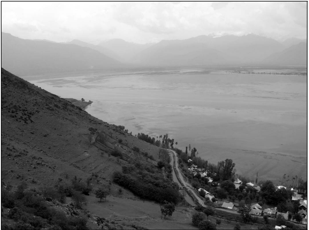
Ил. 7. Озеро Вулар. 1 мая 2013 года

После этой разведочной поездки Рерихов, с середины апреля в течение двух месяцев основным местом сбора экспедиции оставался посёлок Гульмарг (Gulmarg) [ил. 8], расположенный в 50 км западнее Шринагара на высоте 2700 м (34° северной широты). Тридцатого апреля 2013 года на склонах ещё лежал снег. Сейчас здесь известный лыжный курорт. Обширную долину (в переводе это место означает «цветочный луг») окружают покрытые хвойными лесами горы. У отелей на зелёной траве стояли ряды уже ненужных саней, а масса туристов в основном торго-