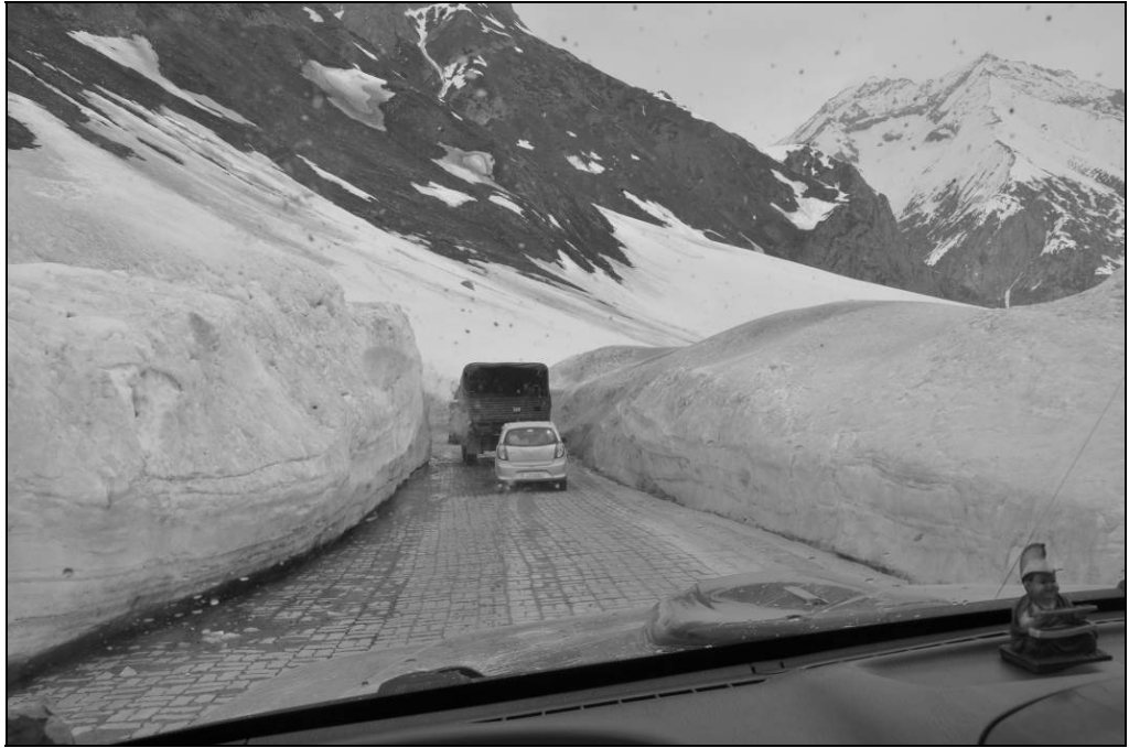
Ил. 9. К перевалу Зоджи Ла. 4 мая 2013 года

там людей, лошадей, торговых лавок, отелей и туристов на машинах и мотоциклах, дорога к перевалу Зоджи Ла (Zoji La, 3528 м) кажется мрачной [ил. 9]. И в начале мая, и в начале июля мы проезжали рядом со снежными стенками, по сложному дорожному серпантину, созерцая вокруг только тёмно-серые скалы. Перевал этот, несмотря на небольшую высоту, имеет дурную славу, и не напрасно. За день до нас в 2013 году снежная лавина снесла в пропасть автобус, а в год смерти Н. К. Рериха здесь в борьбе за ворота в Ладакх в процессе раздела Британской Индии проходили тяжёлые бои индусов с пакистанцами.