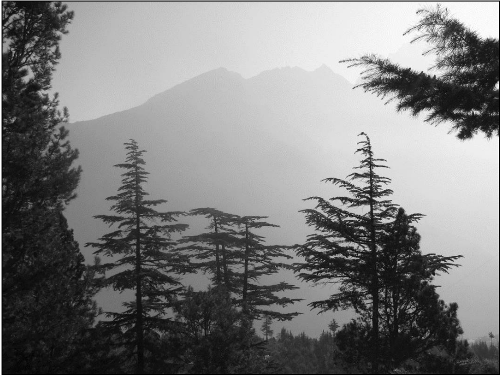
Ил. 2. Вид в сторону Киннорского Кайлаша из Кальпы На переднем плане гималайские кедры. 4 октября 2011 года

Далее маршрут нашей экспедиции 2011 года проходил по долине реки Сатледж (Sutlej), вверх по её течению. В июне 2015 года мы повторно проехали на двух «Тойотах» этим путём, то приближаясь к бурному серому потоку, то глядя на него почти отвесно сверху вниз. Округ Киннор (Kinnaur), по которому протекает река, до сих пор остаётся одним из самых мало заселенных в Индии. До середины XX века эта область была труднодоступна вообще (да и сейчас на многих участках дороги постоянно возникают проблемы), а для посещения иностранцами открыта только в конце 1980-х годов. Именно здесь находится шеститысячник Малый или Киннорский Кайлаш (Kinnaur Kailash) [ил. 2], зимняя обитель Шивы и Парвати, вокруг которой паломники (к ним здесь относятся как буддисты, так и индуисты, многие из которых в этом районе исповедуют одновременно обе религии) осуществляют 3-4-дневный священный обход (с санскрита «парикрама» – странствие). Эту вершину в вечернем и утреннем свете мы наблюдали из отеля «Royal Voyages» в 2011 году и из отеля «White nest» в 2015 году, будучи в посёлке Кальпа (Kalpa), расположенном на противоположной стороне реки. Напомним, что сама река Сатледж начинается далеко отсюда, на территории китайского Тибета, более того – зарождается в западной части священной горы-пирамиды – Большого Кайлаша (там её обход назы-