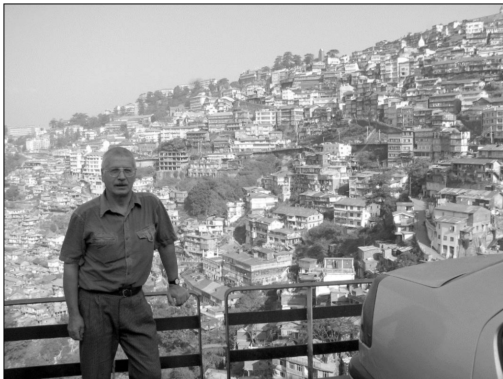
Илл. 1. За спиной автора статьи один из районов города Шимла – столицы штата Химачал Прадеш. 29 сентября 2011 года

ле, в центре города по-прежнему и действует церковь Христа, хотя главной достопримечательностью, вероятно, является расположенная над городом среди кедрового леса статуя Ханумана – бога обезьян (см. статью Б. К. Ганнибала «Деодар – древесный символ Гималаев» в газете «Троицкий вариант: наука», № 9 от 5 мая 2015 года). Необычность города заключается в его положении на крутых горных склонах с преобладанием улиц-лестниц, соединяющих несколько горизонтальных улиц-дорог с главной торговой и прогулочной магистралью – моллом (Mall Road). Здесь бывал и, вероятно, не раз Н. К. Рерих. Как и ему при оформлении разных документов, нам тоже пришлось пройти не простые бюрократические процедуры, в данном случае, чтобы получить разрешение (permit) на проезд в северные, пограничные с Китаем районы штата. Здесь мы провели два дня среди доброжелательных индусов, огромных гималайских кедров и готовых на хулиганские поступки обезьян (о своеволии этих животных писал в своих репортажах из Симлы Р. Киплинг ещё в 1885 году). Здесь в книжном магазине мы приобрели много карт, а также специальной литературы по разным группам животных, справочники по флоре, книги по истории региона.