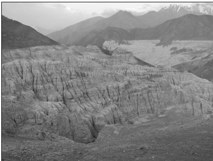
Ил. 12. Ламаюру. Лунные горы. 5 мая 2013 года