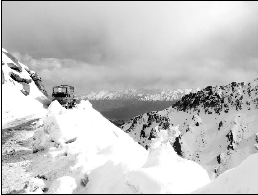
Ил. 14. У перевала Хардунг Ла. 7 мая 2013 года

Производя радиальные маршруты из Леха, мы тоже за всё время экспедиций провели в этом городе в сумме немалое время, при этом пользуясь чаще ресторанным с тибетской кухней, разрешающей употребление мяса.