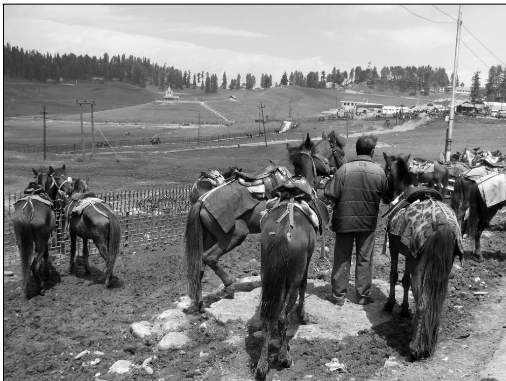
Ил. 8. Курортный посёлок Гульмарг в Кашмире Место сбора в 1925 году экспедиции Н. К. Рериха. 30 апреля 2013 года

Путь до Каргила (Kargil) идёт по территории, населенной мусульманами, в том числе принявшими эту религию тибетцами. После «открыточных» картин (не устаёшь фотографировать направо и налево) в широких горных долинах со стройными высокими пихтам и елями на склонах близ Сонамарга (Sonamarg), обилия