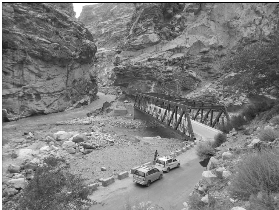
Ил. 3. Мост через реку Сатледж в месте впадения в неё реки Спити и экспедиционные машины. 7 июня 2015 года

вается по-тибетски «корой»). Именно по этой реке и по Инду иногда проводят границу между Гималаями и Трансгималаями, которые, по сути, являются юго-западной границей Тибета.