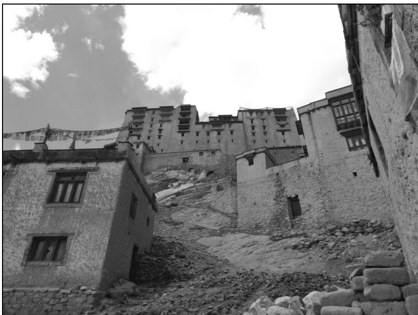
Ил. 13. Царский дворец в Лехе. 17 июня 2015 года