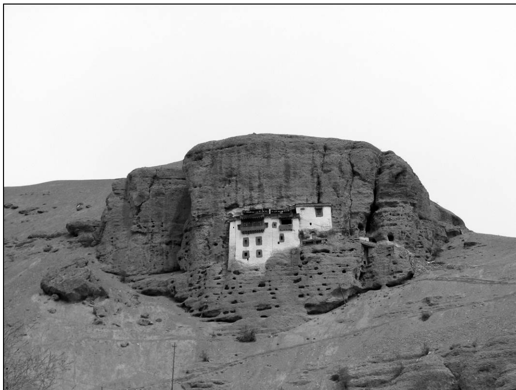
Ил. 10. Пещерный буддийский монастырь Фокар у посёлка Шергол. 5 мая 2013 года

к тысячи лет [ил. 10]. Рядом с ним на крутом песчано-каменистом склоне мы обнаружили редкий вид хохлатки и много других интересных растений.