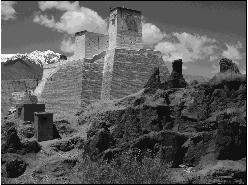
Ил. 11. Крепость Базго, бывшая столицей Ладакха. 28 июня 2015 года

цвета глинистые отложения на месте бывшего когда-то озера, подверженные эрозии, представляют собой своеобразные, почти безжизненные так называемые «лунные горы». Сам монастырь, по некоторым данным, является самым большим в регионе и одним из древнейших, связанных ещё с добуддийской религией Бон. Четыре картины Николая Рериха, посвящённые Ламаюре, написаны в том же 1925 году, к этому образу он возвращался и позднее. Важным символом, связанным с названием этого монастыря, является свастика, изображение которой на одном из склонов видно издали при подъезде к нему.