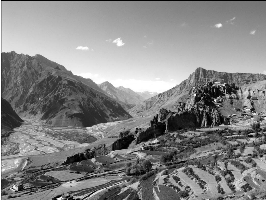
Ил. 4. Монастырь Данкар на вершине горы и террасированный береговой склон долины реки Спити при впадении в неё реки Пин. 6 октября 2011 года

Древние монастыри-крепости располагаются здесь на труднодоступных вершинах, как, например, Данкар (Dhankar) [ил. 4], или просто удалены от магистральных путей на высоте более 4000 м над уровнем моря. Все они относятся к раннему, по европейским меркам, средневековью (VIII–XI век н. э.) и до сих пор хранят многие тайны, которые интересовали Рерихов и которые остаются тайнами по сию пору. Заоблачные выси, фантастические образы природы и встроенные в них памятники архитектуры. Не хочешь, а пойдёшь «вперед и вверх», надеясь найти ту самую загадочную Шамбалу ни за одной, так за другой вершиной, продолжая при этом удивляться тому, как, почему и зачем живут люди в таких тяжелейших условиях. Недалеко отсюда у монастыря с забавным названием Komik мы собрали ценный селекционный материал – семена ячменя, выращиваемого здесь, на высоте 4500 м над уровнем моря – и передали его во Всероссийский институт растениеводства имени Н. И. Вавилова в Санкт-Петербурге. Здесь уместно вспомнить, что великий учёный генетик и ботаникогеограф, чьё имя носит институт, вёл переписку с Рерихами, обращался к ним с просьбой о сборе семян. Были в этом районе и наши находки мирового значения. Так, именно в долине Спити специалистами по земноводным были обнаружены жабы с тройным набором хромосом.