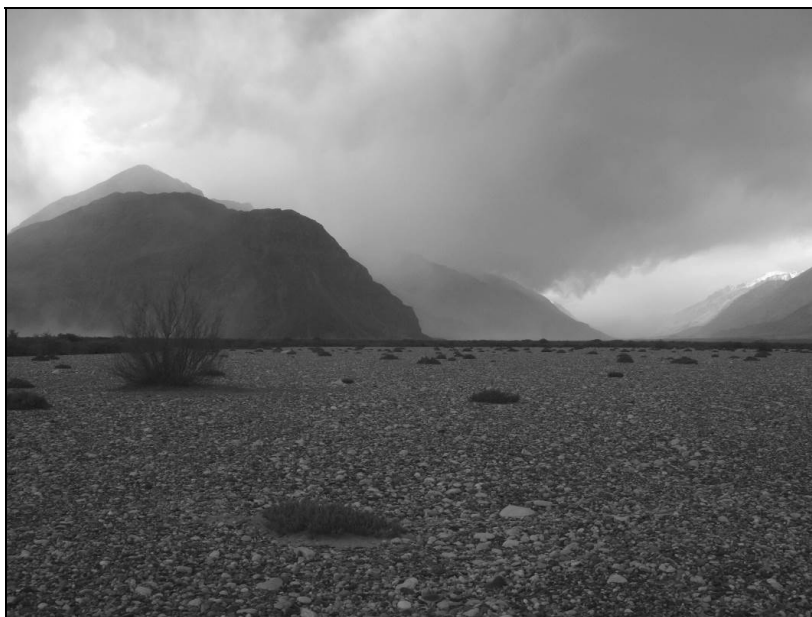
Ил. 15. В преддверии Каракорума Галечники с кустиками эфедры в пойме реки Нубры. 8 мая 2013 года

стороне Нубры (перейти реку не было возможности) зелёный участок конуса выноса, а на нём небольшое поселение Murghi, где закончил свои дни от высотной болезни в 1873 году известный чешский биолог Фердинад Столичка (памятный в его честь обелиск находится на закрытом кладбище моравской протестантской миссии в центре Леха). Наверняка и это научное имя, и эти места были известны Н. К. Рериху.